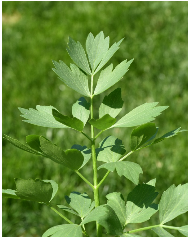
Livèche ( Levisticum officinale ).