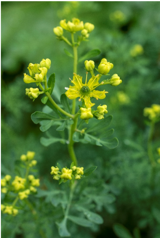
Rue ( Ruta graveolens ).