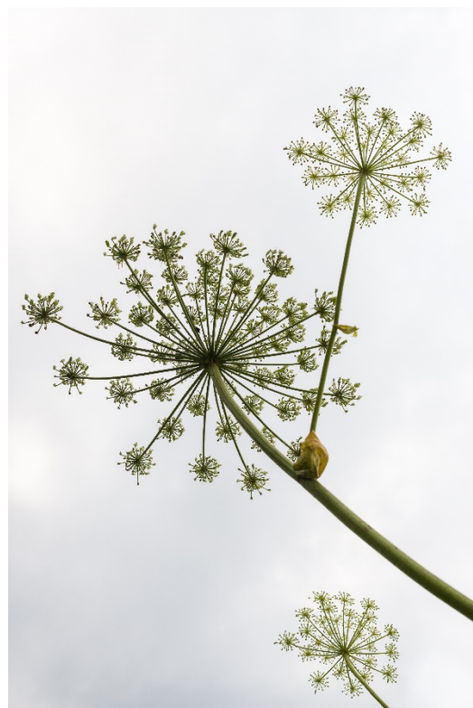
Berce spondyle ( Heracleum sphondylium ) : Fleurs et feuilles.