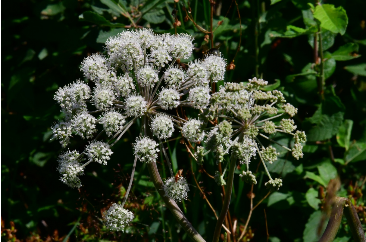
Angélique des bois ( Angelica sylvestris ).