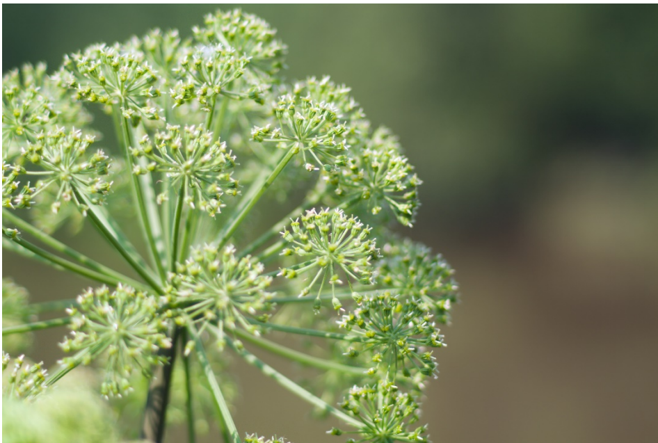
Angélique ( Angelica archangelica ).